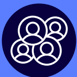
Imagen e influencia

Dirigido a todos los profesionales de la empresa.